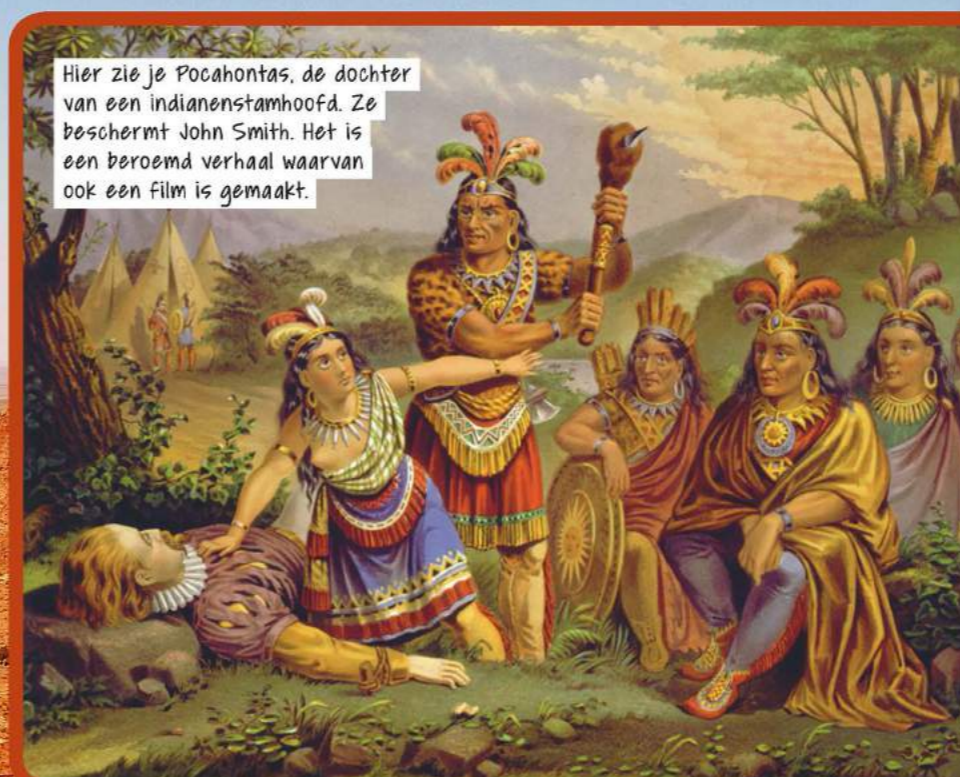
Hier zie je Pocahontas, de dochter van een indianenstamhoofd. Ze beschermt John Smith. Het is een beroemd verhaal waarvan ook een film is gemaakt.

De eerste kolonisten werden vaak overgehaald om te emigreren door handige mannen die daar veel geld aan verdienden. De mensen die wilden