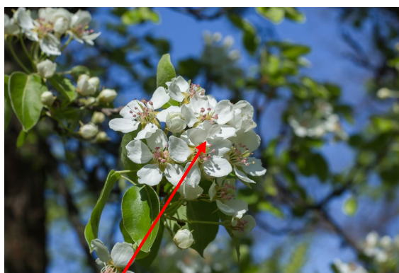
Hier zie je de bloesem

Een perenboom is een fruitboom. In de maand mei komen er witte bloemen aan de boom. Dat noemen we bloesem. Daarna groeien er peren aan de boom. Vanaf de maand oktober kun je de rijpe peren plukken van de boom.